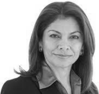
Laura Chinchilla presidenta de Costa Rica 2010-2014

La administración Chinchilla Miranda ha estado envuelta en situaciones muy complejas; sin embargo, sigue el mismo patrón establecido en administraciones anteriores orientadas a terminar de imponer el modelo económico capitalista neoliberal aprovechando el marco de la crisis. Su bandera, al igual que se hizo en la administración Figueres Olsen, es el déficit fiscal, y con ese argumento es que se ataca sistemáticamente la condición laboral, especialmente de los empleados públicos (Ley de Empleo Público