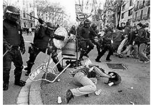
Represión policial en España con los manifestantes que se oponen a las políticas neoliberales

La primera consideración es discernir sobre qué tipo de movimiento se quiere construir y cuáles serían sus objetivos a corto, mediano y largo plazo. ¿Es la vía, la construcción de un movimiento progresista que solo plantee una salida reformista para combatir los aspectos más repudiables del capitalismo pero que no se plantea superarlo o, por el contrario, es la vía de la construcción -si se concluye que no hay salida progresista-, de un movimiento clasista que entre de lleno a explotar ideológicamente la contradicción capital-trabajo que trascienda a una posición anticapitalista y a proyectarse en todas las direcciones para llevar un mensaje clasista a todos los trabajadores (as), con el objetivo a corto y mediano plazo de parar el embate neoliberal y a largo plazo romper el orden de cosas actual y avanzar hacia alternativas revolucionarias?