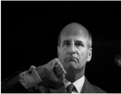
José María Figueres Olsen Presidente 1994-1998

El PAE III, firmado en la administración Figueres Olsen, estrictamente sólo hace referencia al programa acordado con el Banco Mundial; sin embargo, dado que los tres acuerdos firmados con el BID,