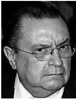
Abel Pacheco Presidente de Costa Rica 2002-2006