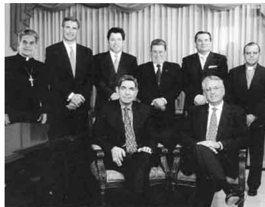
Grupo SAMA, la derecha financiera y representantes de la Iglesia Católica en ese entonces miembros de la Junta Directiva

Las consecuencias de esta decisión terminaron por transformar la naturaleza del Estado costarricense, pues una vez lograda la Presidencia de la República, en un estilo singularmente napoleónico, Óscar Arias y su hermano Rodrigo Arias, como Ministro de la Presidencia (quedando manifiesto que las prácticas nepotistas de los gobernantes costarricenses, se mantienen en pleno siglo XXI, sin que la normativa jurídica del estado burgués costarricense pueda prohibir estas prácticas evidentemente corruptas), se encargan de llevar a su máxima expresión la contrarreforma social iniciada en los años 80's, al servicio ya no solo de los