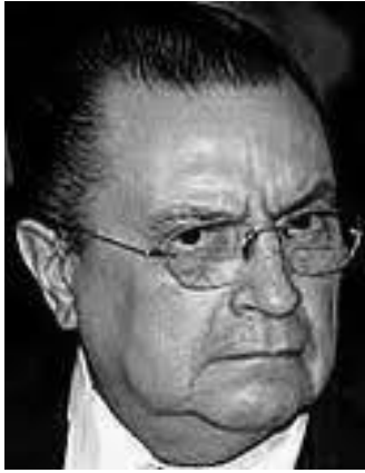
Abel Pacheco de la Espriella Presidente 2002-2006