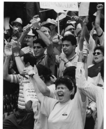
Trabajadores (as) del ICE movilizados contra la transnacional MILLICOM