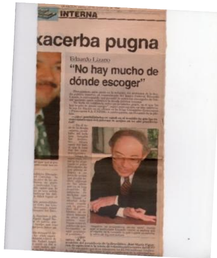
Eduardo Lizano y Oscar Arias en campaña abierta para vender los activos del Estado

tuvo que abandonarse a finales de 1996; sin embargo, es un asunto central por cuanto refleja que el Partido Liberación Nacional ya estaba corrido hacia la derecha y absolutamente plegado a las tesis neoliberales, situación que se confirmaría en los años siguientes.