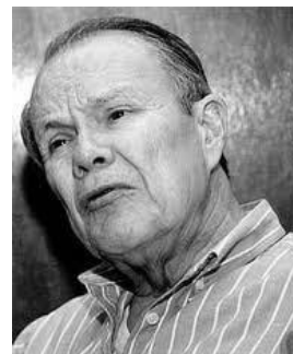
Federico Vargas Peralta Ministro de Hacienda 1982-1986