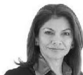
Laura Chinchilla Presidenta, Luis Liberman vicepresidente, sector financiero