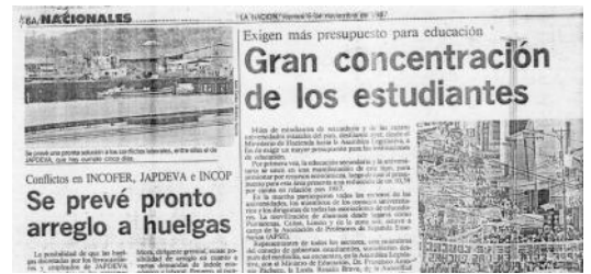
Huelgas y manifestaciones durante la administración Arias Sánchez

La lucha contra la privatización del ICE fue una constante a lo largo de los últimos 30 años. La lucha contra la transnacional Millicom, que se inició a mediados de la década de los 80, culminó en 1995, precisamente en la administración Figueres Olsen, cuando los trabajadores (as) del ICE (sus organizaciones) ante los atropellos y la sumisión del gobierno declararon una huelga indefinida en mayo de 1995, que finalizó de manera favorable a sus intereses y la transnacional Millicom tuvo que suspender sus ilegales actividades empresariales en Costa Rica y abandonar el país. Esa lucha caracterizada como patriótica caló en la conciencia del pueblo.