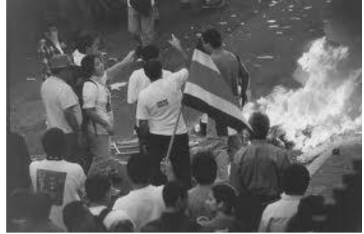
Manifestaciones callejeras contra el “combo del ICE”

Una vez conocida la situación se encendieron las luces de alarma y por supuesto la respuesta para neutralizar esa iniciativa política. En septiembre de 1999, el Sindicato de Ingenieros del ICE en una documento 16 enviado a las organizaciones del Frente Interno de Trabajadores del ICE (FIT) dejó claro que respaldaba esa instancia unitaria pero que, aun cuando existía convergencia en muchas de las acciones, no se podía pretender igualar los criterios o los razonamientos en todas las respuestas hacia lo interno o hacia lo externo y que se había presentado una situación muy compleja por cuanto en la instancia legislativa que se seguía considerando aliada (Fuerza Democrática) en esta lucha, se había presentado un proyecto -salido de la Concertación Nacional- que no fue consultado como se hizo con el de fortalecimiento del ICE y que no cumplía con las expectativas de nuestra organización y mucho menos, para nosotros, con las del desarrollo nacional.