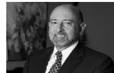
Edgar Ayales, funcionario FMI, ministro de Hacienda