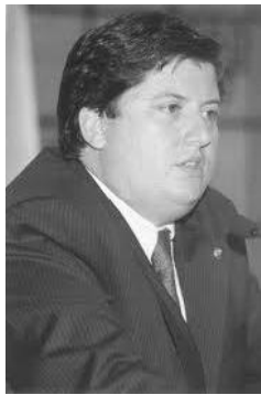
Alberto Trejos ministro de Comercio 2002-2004