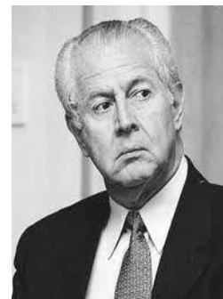
Fernando Naranjo Villalobos, Rodrigo Bolaños Zamora Ministros de Hacienda 1986-1990