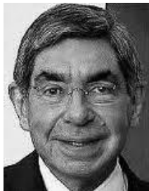
Óscar Arias Sánchez Presidente 2010-2010

La situación político-electoral de Costa Rica se modificó radicalmente cuando un grupo de magistrados