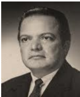
Luis Alberto Monge Álvarez 1982-1986

La aprobación en 1985 del PAE I supuso todo un cambio en la manera de concebir la política económica en Costa Rica. Los fines perseguidos con el PAE I eran la reestructuración del aparato productivo, la