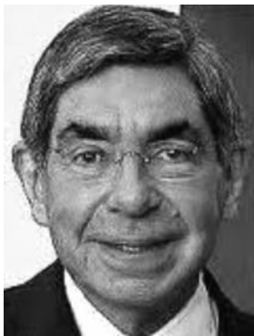
Óscar Arias Sánchez Presidente 1986-1990

En la administración Arias Sánchez (1986-1990) se aprobó el segundo Programa de Ajuste Estructural (1989). El PAE II fue concebido como continuación del PAE I y, por tanto, perseguía los mismos objetivos: la reestructuración del aparato productivo, la diversificación de la producción industrial, la promoción de exportaciones no tradicionales a mercados fuera de la región centroamericana y la democratización económica. Como principal diferencia destacó la desaparición del paquete de medidas dedicadas a la política redistributiva; esta laguna vino a ser salvada, en cierta medida, por la ayuda de la AID. Las medidas aprobadas quedaron recogidas en cuatro paquetes: políticas de exportación, comercio e industria, política agrícola, política del sector financiero y política del sector público.